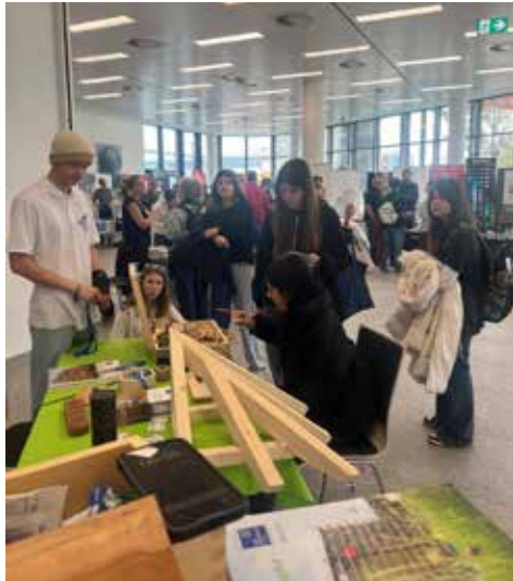
Texte und Fotos: MS Hainburg

Alle Schüler und Schülerinnen der vierten Klassen hatten die Möglichkeit sowohl zahlreiche Infostände als auch unterschiedliche, spannende Workshops zu besuchen. Durch dieses vielfältige Angebot wurden den Jugendlichen weitere Perspektiven aufgezeigt und sie lernten teilweise neue Arbeits- und Ausbildungsplätze der Region kennen. Es war wie immer eine tolle Erfahrung für unsere SchülerInnen.