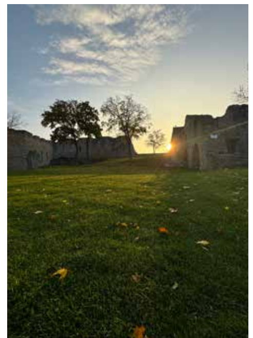
Text und Fotos: AG Schlossberg