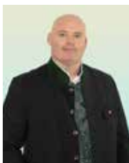
Markus Madle Vize-Bürgermeister Finanz- und Sicherheitsmanagement