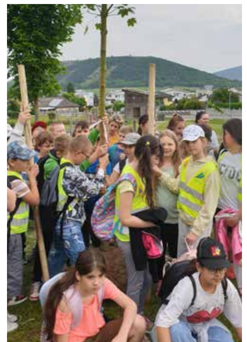
Texte und Fotos: VS Hainburg

Gemeinsam mit dem Bürgermeister Johannes Gumprecht und VertreterInnen der Stadtgemeinde Hainburg sowie VertreterInnen der Gesunden Gemeinde pflanzten die 4. Klassen im Juni Bäume am Spielplatz/Brunnenstraße.