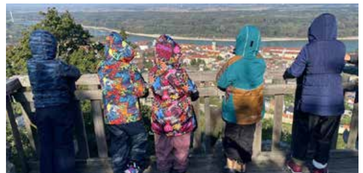
Texte und Fotos: ASO Hainburg